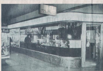
Neu und alt: Der Zugang zur neuen Quick-Bar beim Theaterplatz (oben) und jener in der Marktgass-Passage (unten).