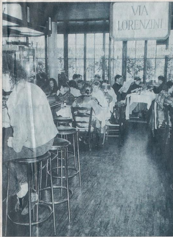
Italienisches Ambiente: So präferierte sich das Ristorante Lorenzini zwischen 1973 und 1995.